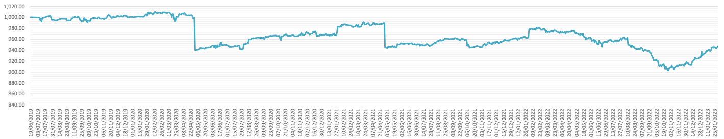
Evolution valeur d'unité